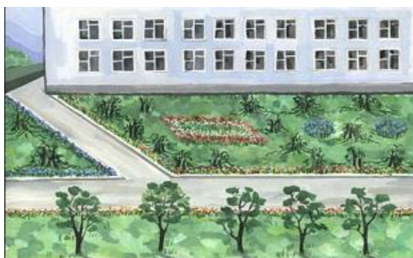
ученик 5 «А» класса Борта Тимофей