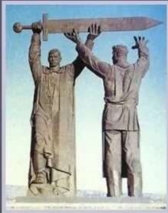
Монумент «Тыл - фронту».