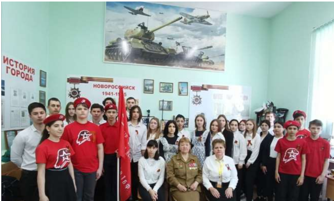
9 МАЯ 2024 ГОДА. ТОРЖЕСТВЕННАЯ ЛИНЕЙКА, ПОСВЯЩЕННАЯ 79-ГОДОВЩИНЕ ПОБЕДЫ В ВЕЛИКОЙ ОТЕЧЕСТВЕННОЙ ВОЙНЕ. «БЕССМЕРТНЫЙ ПОЛК»