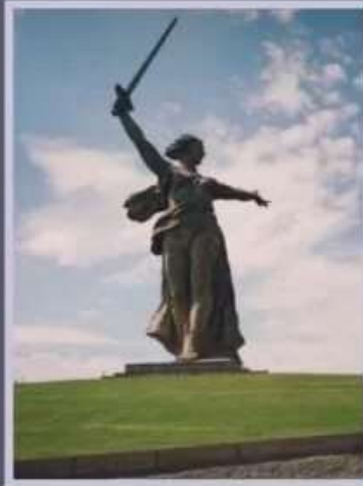
Монумент «Родина - мать».